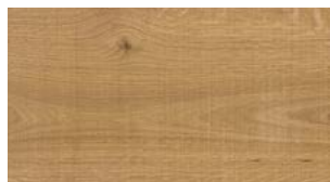
A22 Clay FREE WIDE FREE