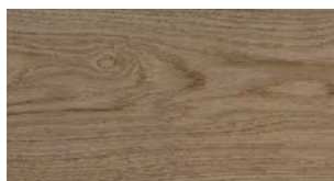
C78 City FREE WIDE FREE