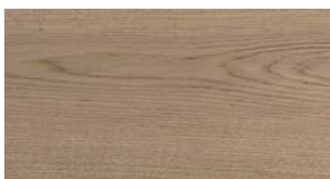
C72 Cognac FREE WIDE FREE