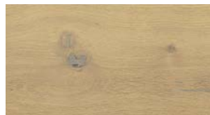
C87 Sabbia FREE WIDE FREE