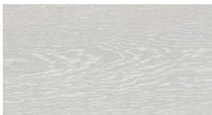
C70 Bianco Neve FREE WIDE FREE