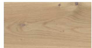
Y25 Naturalizzato FREE WIDE FREE