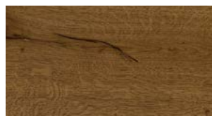
C86 Land FREE WIDE FREE