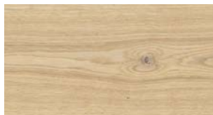
C77 Sand FREE WIDE FREE