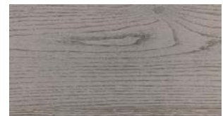
C89 Grey FREE WIDE FREE