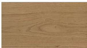
U12 Almond OIL UV FREE WIDE FREE